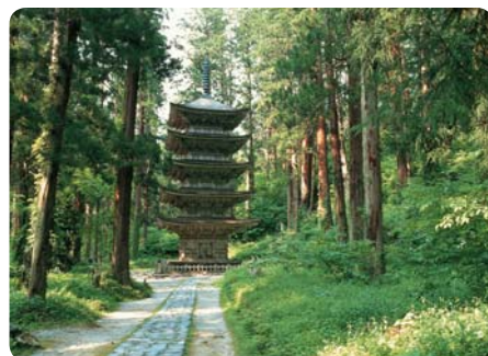
Pagoda na hoře Hagurosan