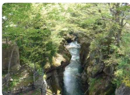
Údolí Rairai-kjó

Historie termálních lázní Akiu, kterým se také dá přezdívat „salón Sendai“, sahá již do dávné minulosti do doby 29. císaře Kinmei (vládl v letech 531–539). Ten trpěl kožní nemocí, ale po koupelích ve vodě, kterou si nechával přivážet z Akiu, se nakonec úplně uzdravil. Akiu se pak stalo lázeňským městem, kam se sjížděli hosté z celého Japonska. V období válčících států (16. století) sem také často jezdil odpočívat významný vládce Tóhoku Date Masamune. Díky překrásnému okolí a horkým pramenům, které se v oblasti nabízejí, Akiu lidé již od pradávna vyhledávají pro odpočinek i uzdravení.