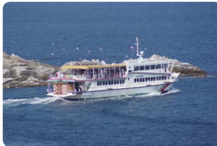
Lod, která přežila zemětřesení v roce 2011