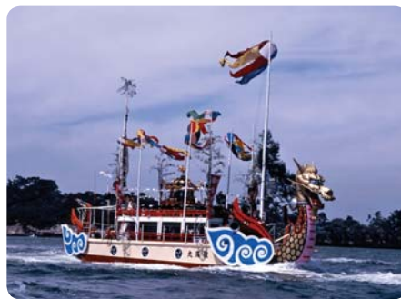
Slavnostní loď Rjúhó-maru

doby Heian. Jedná se o jeden z největších a neznámějších námořních festivalů v Japonsku. Počátky této tradice, kdy se mikroši vynášejí ze svatyně a vozí po moři, ale sahají do dob mnohem dávnějších, a jsou spojeny s každoročním díkůvzdáním šintoistickému božstvu Šiocuci no ōdži, který se v Tōhoku uctívá jako ochránce rybářů a námořníků.