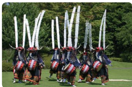
Tanec Šiši-odori (Jelení tanec)