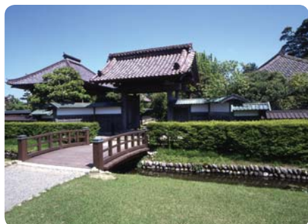
Čidókan – Bývalá škola v Sónai-han

Rozvoj města se datuje od doby, kdy sem své sídlo přesunul kníže Tadakacu Sakai, který byl vnukem Tadačugu Sakaie, významného vojevůdce, který podporoval šóguna Tokugawu Iejasu a vysloužil si za to přezdívku jednoho ze „Čtyř Nebeských Strážců Tokugawů“. Rod Sakai pak v tomto hradním městě vládl až do moderní doby. Z období Meidži (1868–1912) se ve městě dochovaly domy západního stylu s bílými stěnami a další kulturní a historické památky i tradiční festivaly.