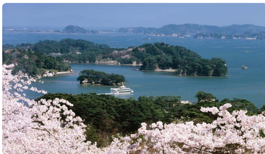
Pohled na záliv Macušima

do vnitrozemí, udělala na něj takový dojem, že v úžasu nad její krásou nenašel slov. V úvodu o Macušimě píše: „To už jsem nemyslel na nic než na lunu nad Ostrovy pinií...“ Další významnou kulturní památkou je blízko se nacházející chrám Zuigan-dži, jeden z hlavních zenových chrámů v Tóhoku, který byl rodovým chrámem zdejšího klanu Date.