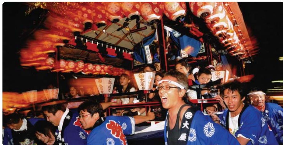
Jízda slavnostního vozu daši