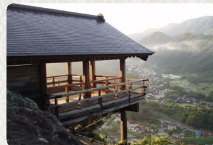
Pohled z chrámu Godaidó

navštívil a ve své poezii zachytil slavný básník Macuo Bašó.