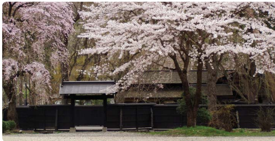
Dům samurajské rodiny Iwahaši se stromy sakury

Kakunodate je součástí města Senboku v prefektuře Akita. Jedná se o hradní město obklopené ze tří stran horami, kterému se pro jeho atmosféru, historické samurajské domy a sakurovou alej právem přezdívá „Malé Kjóto Tóhoku“ (Mičinoku no Kjóto). Za svou dnešní podobu vděčí Kakunodate místnímu feudálnímu vládci jménem Ašina, který roku 1620 nechal vystavět nový systém ulic. Město bylo rozděleno na dvě části: na sever od centra se rozkládá čtvrt samurajských domů, která dříve tvořila tzv. vnitřní město učimači, přičemž jižní část města, zvanou tomači, obývali měšťané a obchodníci. Uprostřed se nachází prázdné prostranství hijoke, které mělo sloužit jako ochrana před šířením požárů. Toto rozvržení města se dochovalo i po 390 letech prakticky beze změny. Zdi samurajských domů v učimači jsou lemovány řadou převislých sakur starých téměř 200 let. Hlavní ulice procházející čtvrtí těchto samurajských domů je dnes památkově chráněna.