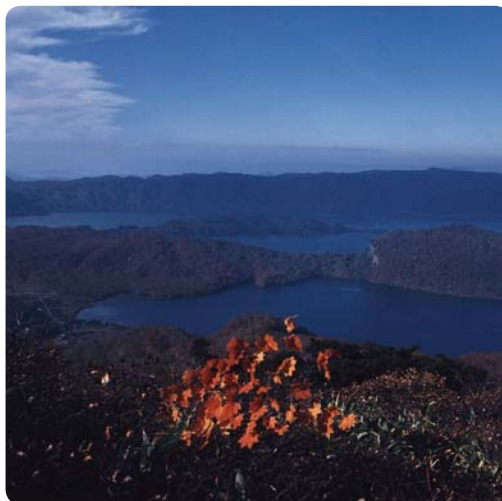
Pohled na jezero Towada

Jezero Towada se rozkládá v typické dvojité kaldeře a zabírá plochu 59 km 2 . Svou hloubkou 327 m je třetím nejhlubším jezerem v Japonsku. Voda v jezeře Towada je vyjímečně průzračná a lze dohlédnout až do hloubky 15 m. Horní tok Oirase, jediné řeky, která z jezera vytéká, tvoří na 14 km úseku mezi Nunokuči a Jakejama nádhernou soutěsku se strmými skalními stěnami, které jsou porostlé lesem. Okolí Oirase nabízí překrásné scenérie v každém ročním období. Jeho malebnost dotváří několik vodopádů, jako např. vodopád Kumoi, peřeje Ašura nebo vodopád Čóšiótaki, nazývaný také Uodome no taki, což doslova znamená „vodopád, který brání rybám plout proti proudu“.