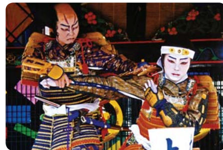
Dětské divadlo kabuki