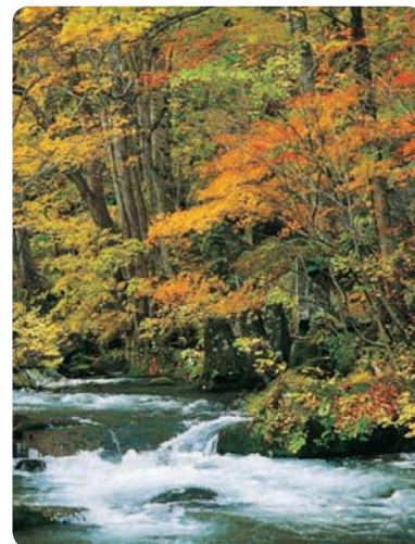
Peřeje potoka Oirase