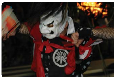
Tanec Oni kenbai daigunbu