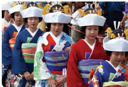
Nanahokai (průvod nevěst)