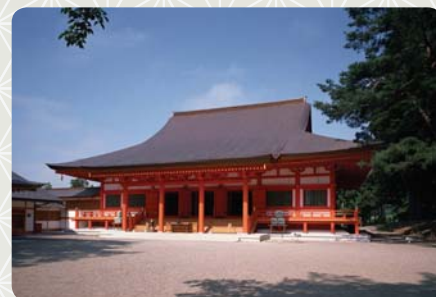
Hlavní chrám Mócúdži

Ve vnitřní svatyni se nachází 33 soch, z nichž nejvýznamnější je ústřední socha sedícího Buddy Amitábhya. Celá stavba byla zamýšlena jako mauzoleum, a jsou v ní pohřbeni čtyři vládci z rodu Fudžiwarů, kteří tuto oblast ve 12. století ovládali. Spolu s úložištěm sůter je Zlatá Síň jedinou původní stavbou, která se v chrámovém komplexu Čúsondži dochovala dodnes.