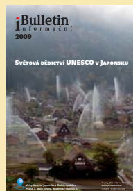
Informační bulletin 2009