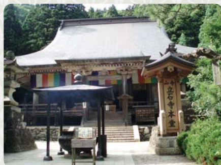
Hlavní chrám Konpončúdó

Chrám Riššakudži buddhistické sekty Tendai, zabývající se asketickou praxí. Proto byl založen na těžce dostupném terénu hory Hódžu ve městě Jamagata. Přestože hlavní budova se nachází na horském úpatí, většina budov stojí na velmi strmém svahu a některé z nich jako kdyby byly přilepeny přímo na skály. K jejich návštěvě je třeba postupně vystoupat asi po tisíci kamenných schodech. Každým krokem se přitom dle tradice pouťníci osvobozují od jedné světské vášně. Nejvýše umístěná budova chrámového