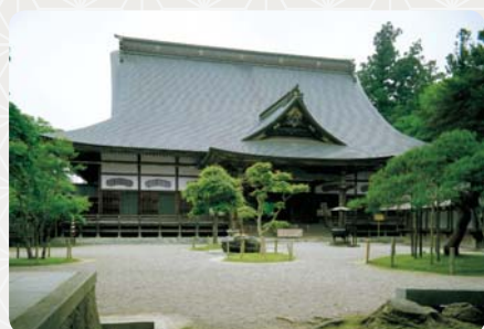
Hlavní chrám Čúsondži

Chrást Čúsondži se nachází na kopci jménem Kanzan a od nádraží Hiraizumi k němu vzhůru vede alej lemovaná mohutnými cedry starými až 400 let. Chrást zde údajně existoval již od 9. století, ale s jeho stavbou v dnešní podobě začal až Kijohira ze severní větve rodu Fudžiwaru na počátku 12. století. Podle záznamů z oficiálních šógunátních