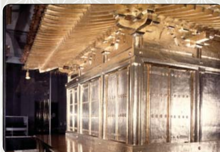
Zlatá Síň Kondziki-dó

kronik zde vyrostlo na 40 síní a pagod a přes 300 obydlí pro mnichy.