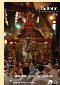
Informační bulletin 2011