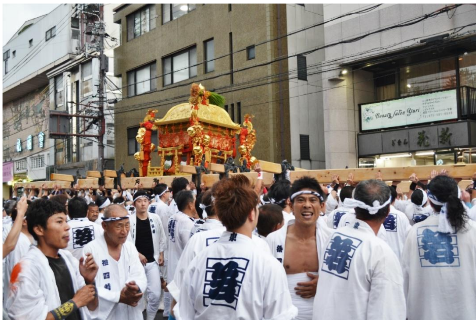
Přenosná svatyně mikoši na největší kjótské slavnosti Gion macuri

Život v Japonsku (a pro mě osobně v Kjótu více než kde jinde) skýtá celou řadu potěšení. Kjóto (podobně jako např. blízká Nara) je proslulé svými historickými památkami a dosud živými tradicemi, ať už z doby před několika staletími nebo jen desítkami let. Snad není dne, kdy by se tu nekonala nějaká náboženská slavnost nebo festival. Ač každým rokem přibývá zahraničních turistů a nejoblíbenější památky (a městské autobusy) praskají ve švech, jsou tyto záplavy návštěvníků lokalizovány v malých ostrůvcích a Kjóto se tak ještě neproměnilo v turistický skanzen. Kjóto je také studentské město: existuje tu přes třicet univerzit s vysokým počtem zahraničních studentů.