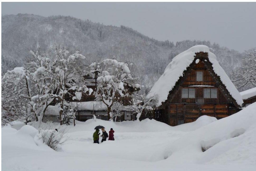
Vesnice Širakawagó v zimě

Studium se neobešlo bez dílčích nesnází a probdělých nocí, nicméně i díky této přípravě se mi podařilo znovu získat stipendium MEXT a v roce 2019 jsem mohl zahájit studium klasické literatury v magisterském programu v Japonsku. Bez zkušenosti z programu nikken by to nepochybně bylo výrazně obtížnější.