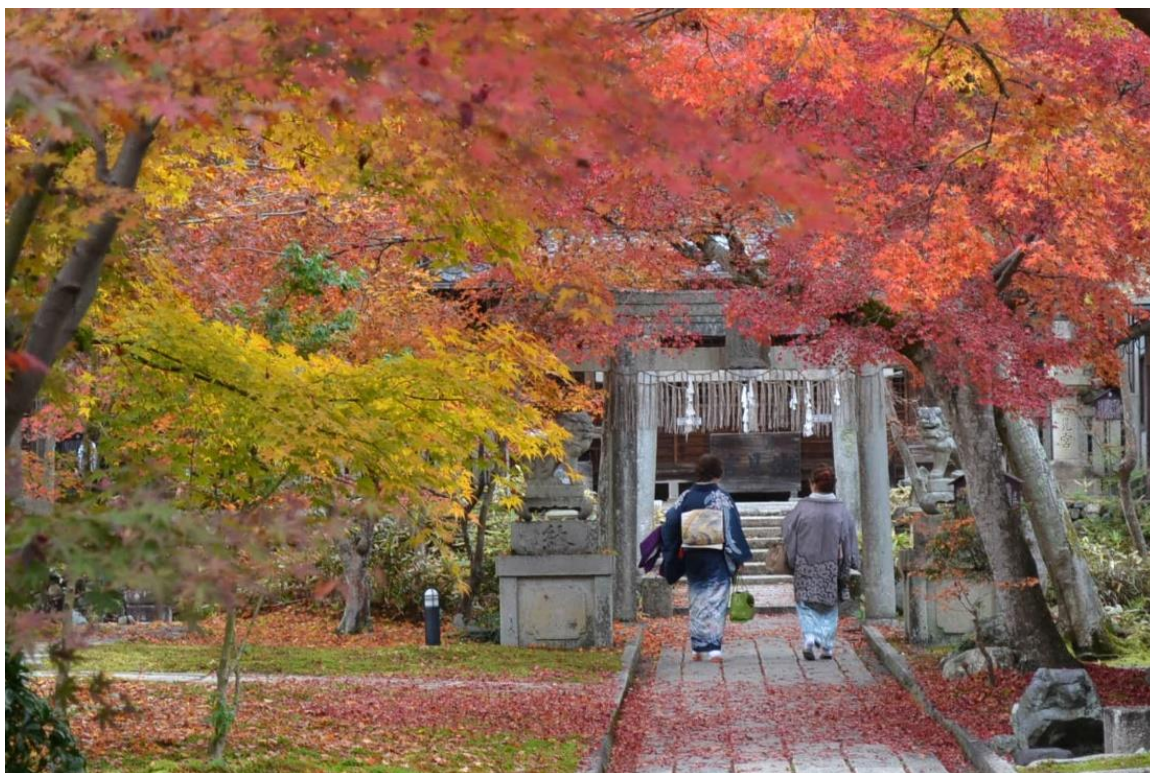
Podzim v Kjótu

V programu na Kjótské univerzitě nás studovalo okolo dvacítky, přičemž zhruba polovina studentů pocházela z východní Asie a druhá polovina z Evropy a USA. V současné době program probíhá v poněkud pozměněné podobě, v roce 2016 nicméně sestával ze tří hlavních součástí: skeletových kurzů, velkého množství mimořádných přednášek (včetně exkurzí) a individuálního výzkumu, jehož výstupem je závěrečná práce zhruba v rozsahu práce bakalářské, vše z toho v japonštině. Skeletové kurzy pokrývaly vybrané oblasti japonské kultury a společnosti – např. moderní historii a současné společenské problémy, klasickou a moderní literaturu, lingvistiku (některé kurzy byly společné pro japonské studenty) – a zčásti pak byly věnovány akademickým dovednostem: akademickému čtení, psaní a prezentacím.