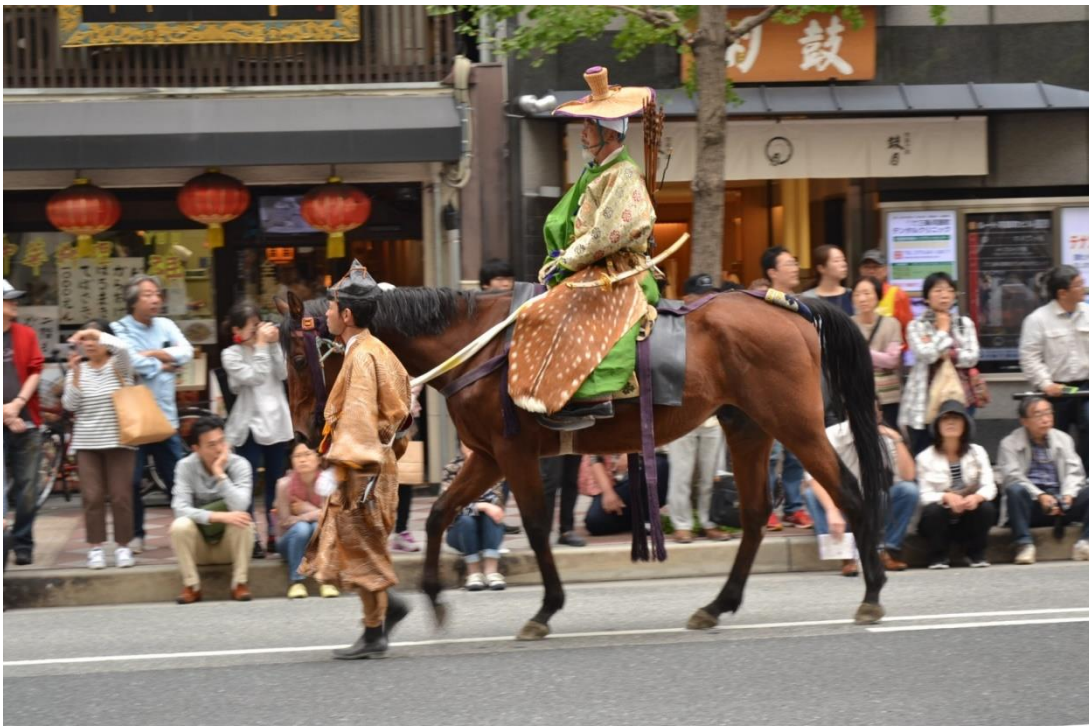
Z průvodu v historických kostýmech v rámci festivalu Džidai macuri

Nejdůležitější částí programu byl individuální výzkum. Téma si studenti volili sami a zpracovávali ho pod vedením přiděleného pedagoga. Každý týden pak na semináři či individuálních konzultacích prezentovali průběžné výsledky. Mimoto za rok třikrát proběhla simulovaná konference za účasti všech vyučujících. Závěrečné práce byly potom vydány ve sborníku. Podmínky pro studium jsou na Kjótské univerzitě takřka ideální – k dispozici je řada kvalitně vybavených knihoven s dlouhou otevírací dobou, včetně studoven otevřených 24 hodin denně.