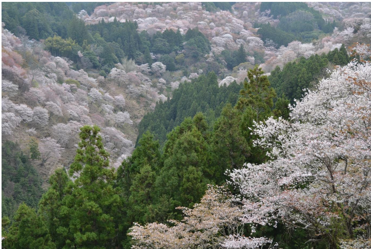
Kvetoucí sakury v Jošinu

Rok strávený v Japonsku byl plný větších či menších překvapení, na která se jen tak nezapomíná. Za možnost to vše zažít jsem velmi vděčný a budoucím studentům bych přál, aby si tuto příležitost také nenechali uniknout.