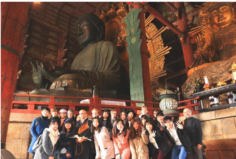
S kolegy v chrámu Tódaidži v Naře

Rok studia na japonské univerzitě je pro studenty japanologických oborů nedocenitelnou zkušeností, už jen kvůli možnosti prohloubit své jazykové znalosti a hned je otestovat v akademickém prostředí i v každodenním životě. Mně se taková příležitost naskytla díky stipendiu Nikkensei a akademický rok 2016-2017 jsem tak mohl strávit na Kjótské univerzitě. Tzv. programy nikken, primárně určené právě pro japanology na bakalářském stupni, nabízí okolo sedmdesáti japonských univerzit a svým absolventům by měly umožnit osvojit si takové dovednosti, které jsou nezbytné pro další „profesionální“ působení v Japonsku, ať už v navazujícím studiu nebo třeba v zaměstnání v soukromé sféře.