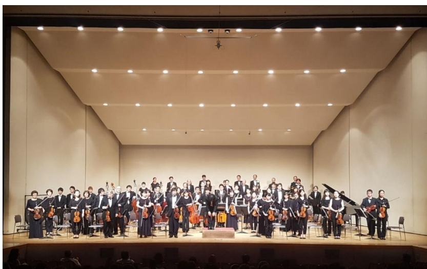
Koncert s Kyoto City Philharmonic

Japonské univerzity jsou známé studentskými kluby, v jejichž rámci se jejich členové věnují sportu nebo uměleckým či jiným aktivitám. Převážně z časových důvodů jsem byl o tuto zkušenost ochuzen, nicméně jelikož hraji na housle a chtěl jsem v tomto koníčku pokračovat i v Japonsku, stal jsem se na rok členem amatérského uskupení Kyoto City Philharmonic Orchestra. Je sice všeobecně známo, že Japonci mají rádi klasickou hudbu (a mnoho z nich má zájem i o jiné, pro nás leckdy překvapivé oblasti kultury a společnosti západních, resp. nejaponských zemí), ale nedovedl jsem si docela představit, do jaké míry. Zdá se mi, že amatérských orchestrů a jiných uskupení v Japonsku existuje více než v Česku a v každé čtvrti i menší obci bývá kulturní centrum s multifunkčním sálem, vhodným i pro symfonickou hudbu. S orchestrem jsme mj. provedli Čajkovského Šestou symfonii nebo Beethovenův Čtvrtý klavírní koncert.